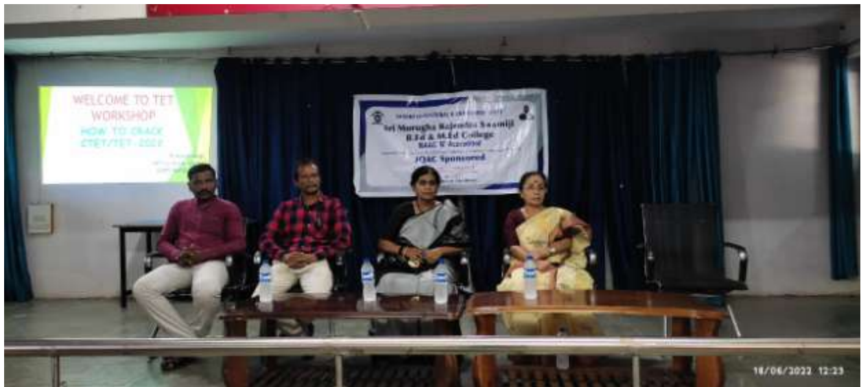
Orientation on KAR-TET