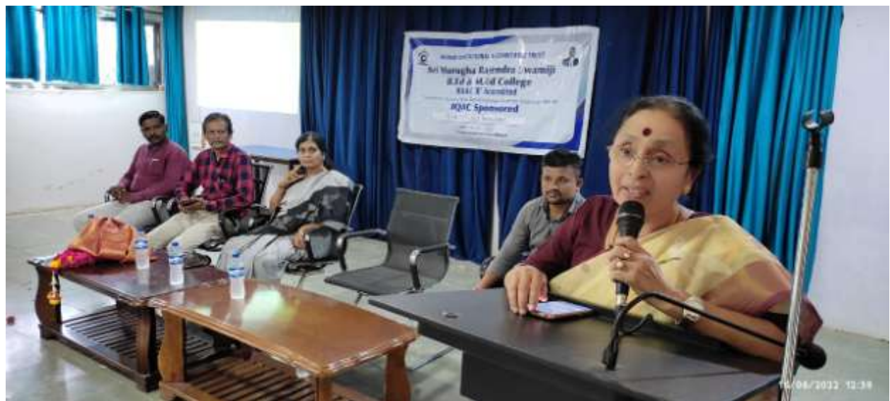
Addressed by Resource Person