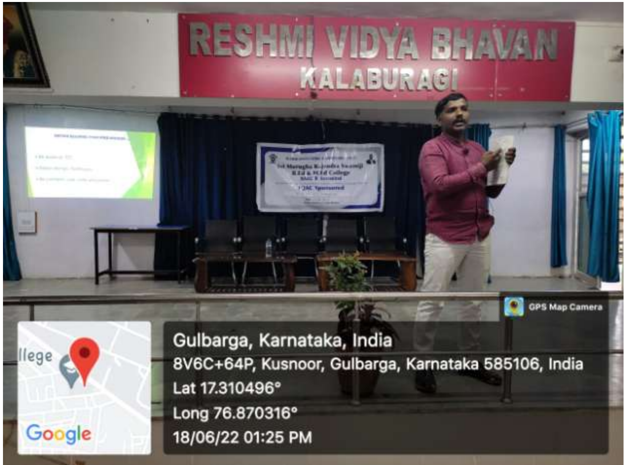
Free Orientation on KAR-TET-2022