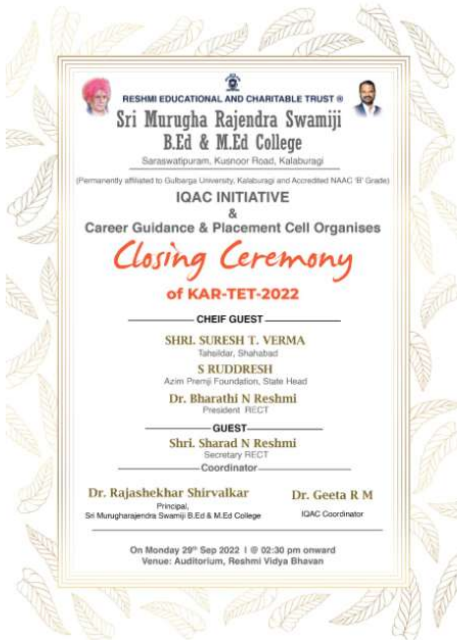
Closing Ceremony card