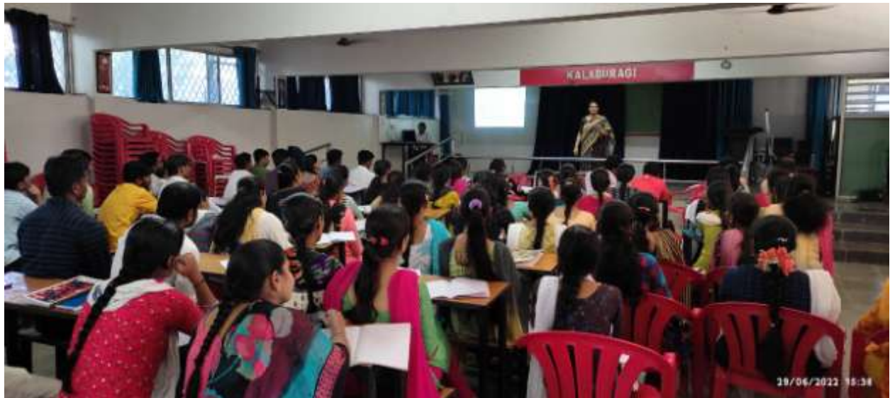
Classes on KAR-TET-2022