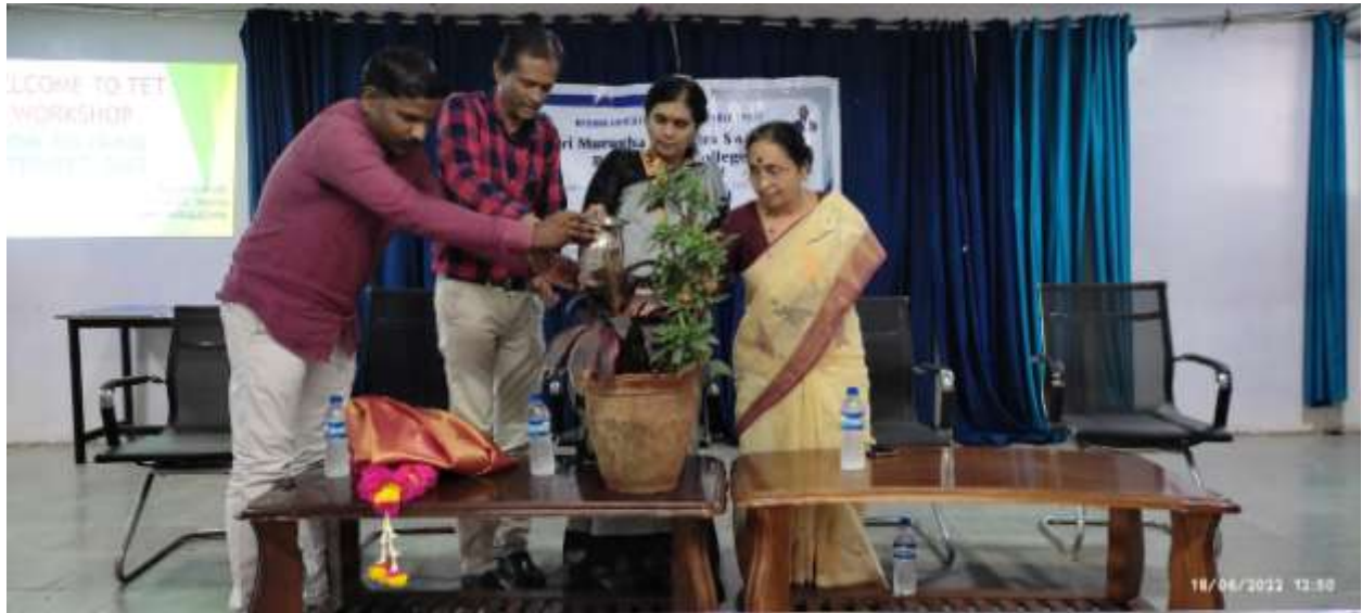
Inaugural of KAR-TET-2022