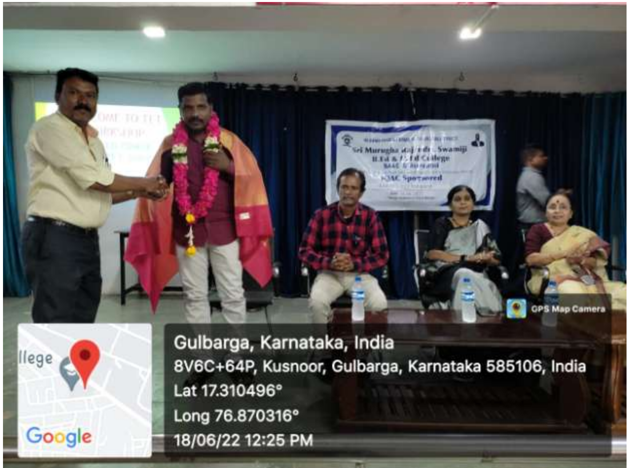
Welcome and Honour to Recourse Person